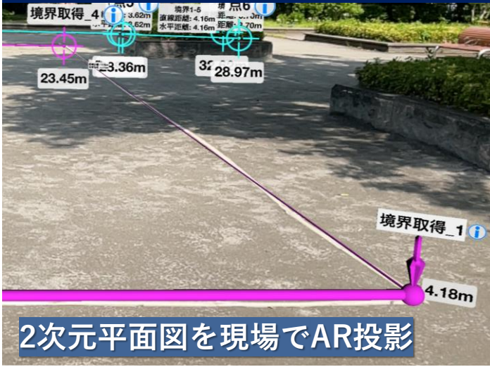
2次元平面図を現場でAR投影