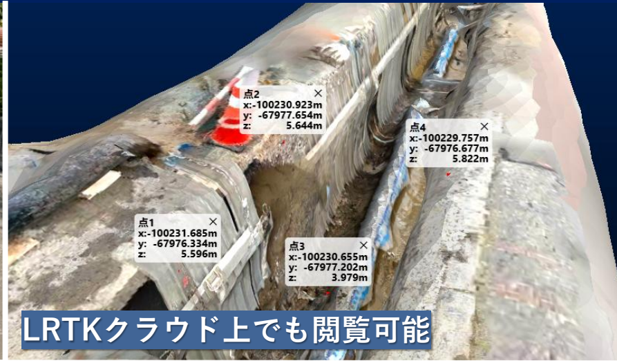
LRTKクラウド上でも閲覧可能