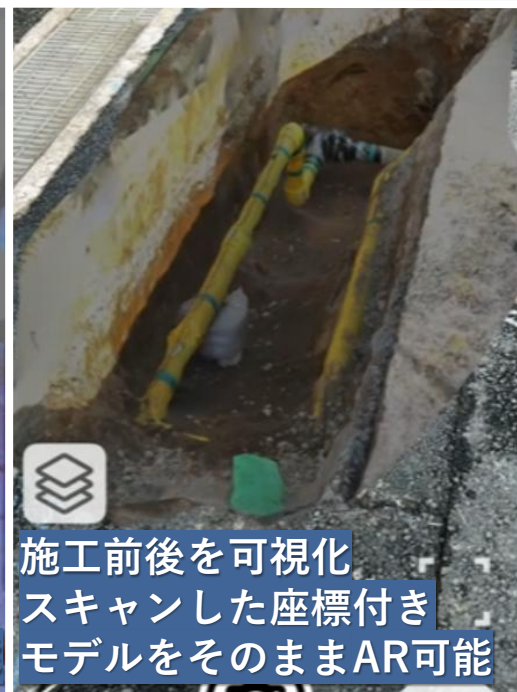
施工前後を可視化 スキャンした座標付き モデルをそのままAR可能