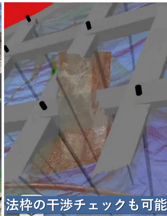
法枠の干渉チェックも可能