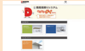
見積りシステム「みつもりダイちゃん」

最新のカタログがパソコン、スマートフォン、タブレット端末などでご覧いただけます。