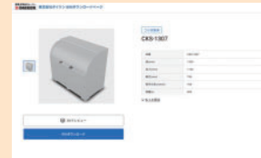
データダウンロードサービス

駐輪場屋根、自転車ラック、ひさしの設置台数や価格が、WEBサイト上で簡単にシミュレーションできます。