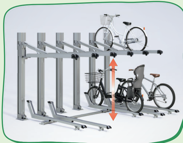
▼駐輪場屋根(ハイルーフタイプ)との組み合わせ例