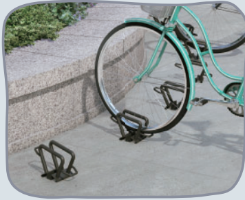
独立式サイクルスタンド CS-C