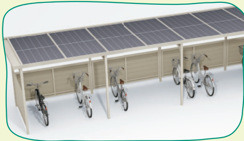
太陽光発電が可能な駐輪場屋根 ソーラーサイクルロビー CY-PVH