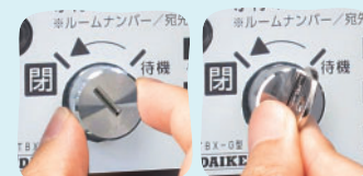
特殊シリンダー錠で開閉操作