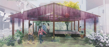
01. プロローグ ステーション化する都市と目撃者の像