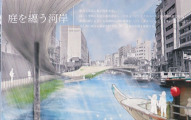
4. 2-1 断面 (1)

豊洲2地区は高層ビルが立ち並び、緑が乏しい環境である。また、河川の水質改善が求められる中、周辺住民の憩いの場を創出するべく、水辺空間の再生を計画する。