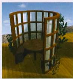
イス&テーブルのスペース。 3、4人で使用可能。