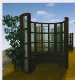
フローリング型のスペース。 1人～2人用。